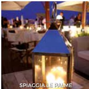
SPIAGGIA LE PALME