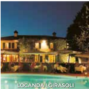
LOCANDA I GIRASOLI