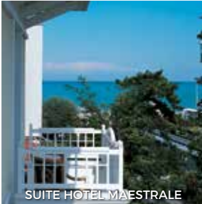
SUITE HOTEL MAESTRALE