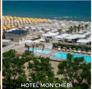
HOTEL MON CHERI